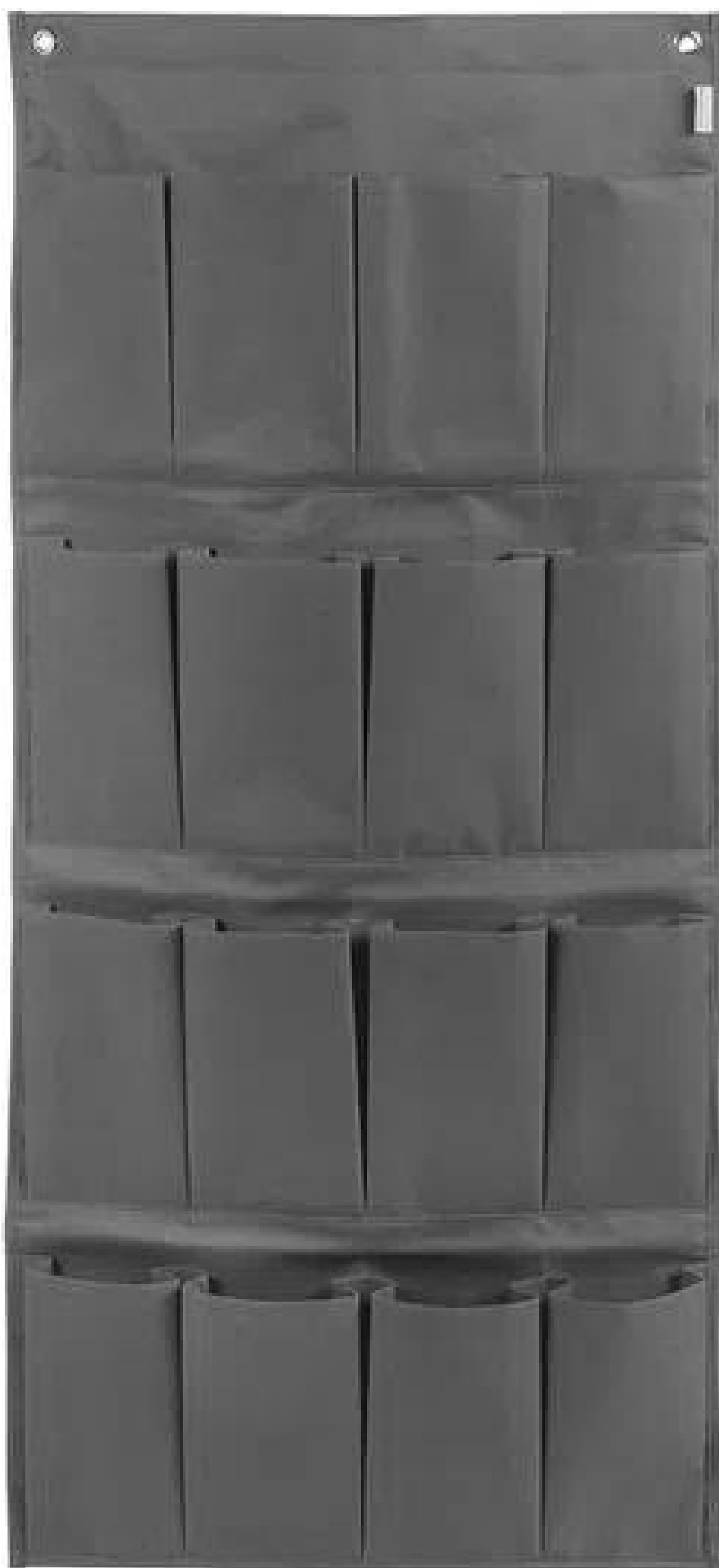
Sapateira de parede, Tokstok