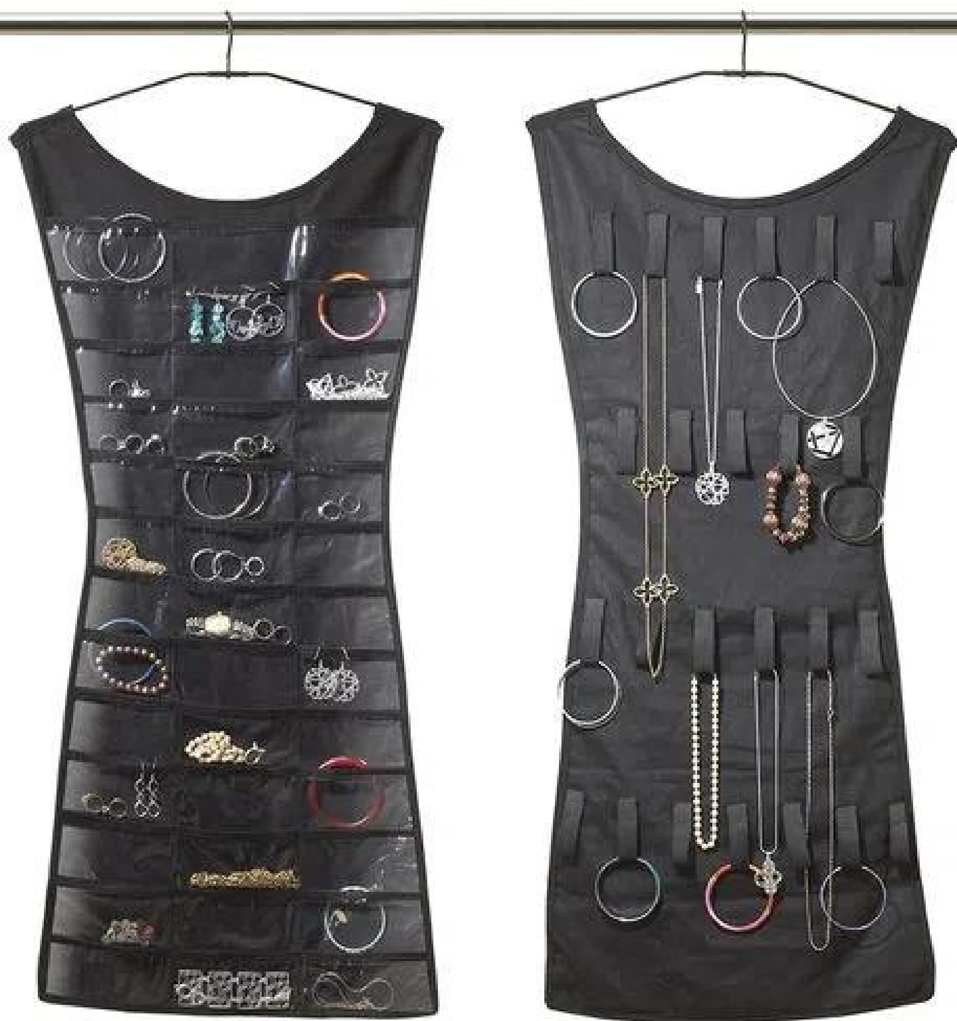
Organizador de acessórios "little black dress", Tokstok