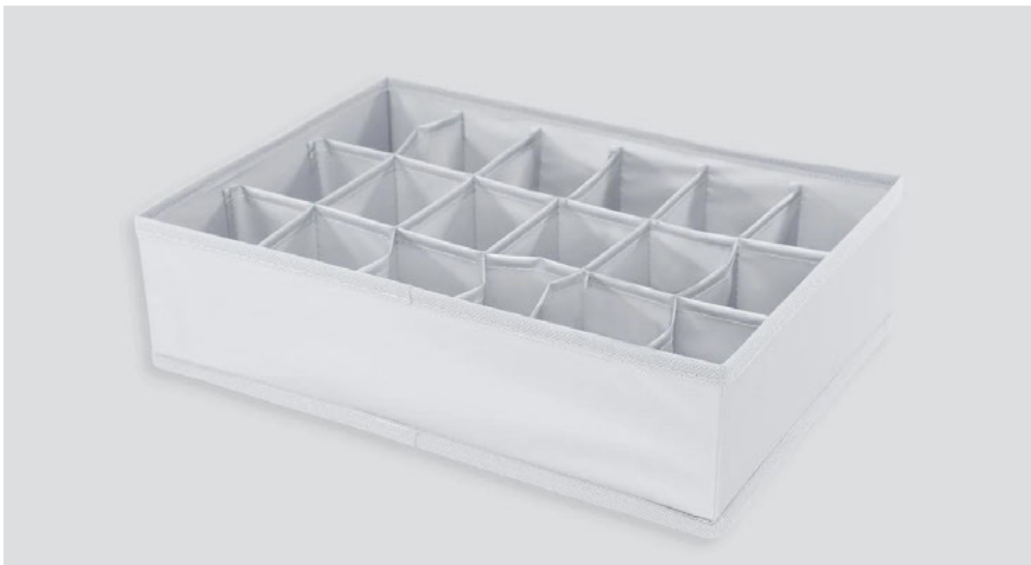
Colméias com 3, 6 e 12 divisórias, Amaro